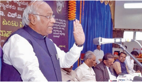
రేపు కాంగ్రెస్ నేతృత్వంలో అఖిలపక్షం మహిళా లబ్ధిని పట్టణ వ్యతిరేకం కాదు : ఖర్జు

బెంగళూరు, ఏప్రిల్ 13: కేంద్ర ప్రత్యేక పార్లమెంటు సమావేశాల్లో ప్రతిపాదించిన పన్ను మహిళా రిజర్వేషన్ బిల్లుకు కాంగ్రెస్ పార్టీ వ్యతిరేకం కాదని ఆ పార్టీ జాతీయ అధ్యక్షుడు మల్లికార్జున ఖర్జు స్పష్టం చేశారు. మహిళా బిల్లుతోపాటు నియోజకవర్గాల పునర్విభజన ప్రతిపాదనను తాము తీవ్రంగా వ్యతిరేకిస్తున్నామని పేర్కొన్నారు. సోమవారం బెంగళూరులో మీడియా సమావేశంలో ఎవని అధ్యక్షుడు మల్లికార్జున ఖర్జు మాట్లాడుతూ, మహిళా రిజర్వేషన్ చట్టం అమలు చేశాకా మహిళా పునర్విభజన అత్యంత ముఖ్యమైన అంశమన్నారు. నియోజకవర్గాల పునర్విభజన అత్యంత ప్రమాదకరమైనదిగా అభివ్యక్తిచేశారు. లోకసభ సీట్ల సంఖ్య పెంచే ఏ పునర్విభజన అయినా కేవలం సంఖ్యాపరంగానే కాకుండా, రాజకీయంగా కూడా సమానంగా ఉండాలని అభిప్రాయపడ్డారు.