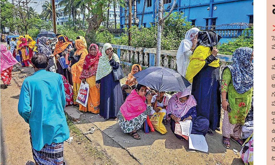
బెంగాల్ లోని ముర్షీదాబాద్ లో సర్వే అప్పీలు చేయడానికి శ్రీమొసల్ వద్ద వేచి ఉన్న ప్రజలు